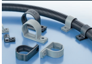
Tube clamp one-piece